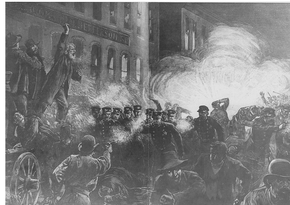
The Haymarket Riots in Chicago, 1886

When May 1st came, 340,000 workers in North America went on strike, 40,000 in Chicago alone. Capitalists relied on policemen and soldiers for protection. They tried to stop the mass protests with murder and brutality, killing four people on May 3rd.